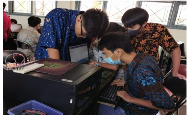
Gambar 3 Peserta melakukan pengkodean IDE Arduino dan membuat rangkaian LED

instruksi maupun quiz yang diberikan. Pengkodean yang dilakukan kemudian diupload ke mikrokontroler Arduino. Selain itu, Gambar 4 menunjukkan foto bersama tim dosen Universitas Buddhi Dharma sebagai pengajar dengan para peserta pelatihan.