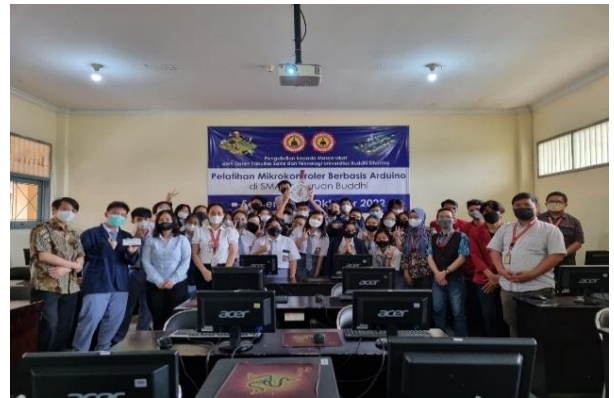
Gambar 4 Foto bersama para pengajar dan pelajar