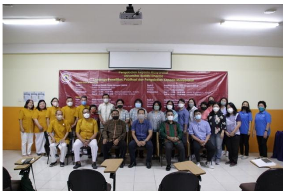
Gambar 3 Sesi Foto Bersama pada Pelatihan Kewirausahaan Anggota Magabudhi Kota Tangerang