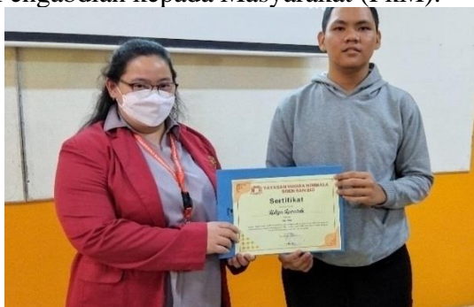
Gambar 11 Penyerahan Sertifikat Kepada Mahasiswa

berkontribusi dalam keberhasilan Program Pengabdian kepada Masyarakat (PkM).