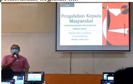
Gambar 1 Pembacaan Doa Oleh Romo Pandita dan Sambutan Yayasan Vihara Nimmala

Selanjutnya, para peserta mendengarkan sambutan dari perwakilan Yayasan Vihara Nimmala, yang merupakan pihak yang sangat berperan dalam penyelenggaraan acara ini. Sambutan ini tidak hanya sebagai sambutan formal, tetapi juga sebagai pernyataan harapan dan tujuan dari Yayasan Vihara Nimmala terkait pelaksanaan kegiatan ini.