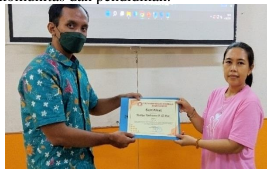
Gambar 10 Penyerahan Sertifikat Kepada Pemateri

Gambar di atas menggambarkan momen berharga saat penyerahan sertifikat kepada tim pelaksana Program Pengabdian kepada Masyarakat (PkM) oleh Yayasan Vihara Nimmala. Moment ini merupakan simbol pengakuan dan apresiasi atas dedikasi serta kontribusi yang telah diberikan oleh tim pelaksana dalam menjalankan kegiatan PkM dengan sukses. Selain itu, penyerahan sertifikat juga mencerminkan kerjasama yang erat antara universitas dan yayasan dalam mendukung pengembangan komunitas dan pendidikan.