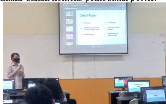
Gambar 3 Penyampaian Materi Oleh Pemateri

Acara berlanjut dengan pemateri yang melanjutkan dengan sesi pertama, yang mencakup pengenalan terhadap aplikasi Canva, termasuk panduan langkah demi langkah dalam membuat akun. Selanjutnya, sesi berlanjut ke sesi kedua, yang merupakan tahap praktek praktis dalam pembuatan desain poster menggunakan aplikasi Canva. Dalam sesi ini, peserta akan dipandu secara rinci melalui proses pembuatan desain poster yang efektif dan kreatif dengan memanfaatkan fitur-fitur Canva. Kombinasi dari materi pengenalan dan praktek langsung ini bertujuan untuk memberikan pemahaman mendalam kepada peserta tentang cara mengoperasikan aplikasi Canva dengan mahir dalam konteks pembuatan poster.