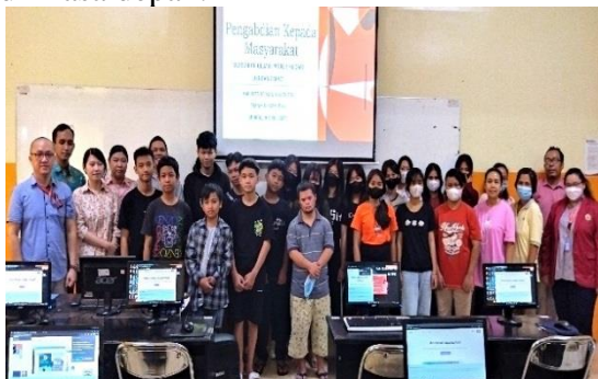
Gambar 8 Foto Bersama Peserta Kegiatan PkM

Kegiatan ini diakhiri dengan momen berharga berupa foto bersama, yang melibatkan seluruh peserta yang hadir. Setelah itu, sebagai tindak lanjut dari keberhasilan dan partisipasi aktif dalam kegiatan PkM ini, dilakukan penyerahan sertifikat kepada berbagai pihak yang telah berkontribusi secara signifikan. Penyerahan sertifikat ini meliputi tim pelaksana yang telah bekerja keras untuk mengorganisir acara, para pemateri yang telah berbagi pengetahuan dan pengalaman mereka dengan peserta, serta mahasiswa yang turut mendampingi para peserta dalam menjalani kegiatan PkM ini. Dengan tindakan ini, diharapkan bahwa penghargaan ini dapat memberikan apresiasi kepada semua pihak yang telah berperan dalam keberhasilan acara ini dan juga mendorong semangat mereka untuk terus berkontribusi dalam kegiatan serupa di masa depan.