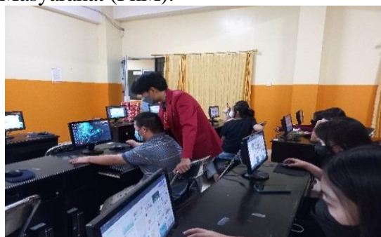
Gambar 6 Praktek Membuat Poster Dengan Canva

Gambar 5 adalah dokumentasi bantuan yang diberikan oleh pendamping narasumber kepada peserta yang mengalami kesulitan selama kegiatan praktek Program Pengabdian kepada Masyarakat (PkM).