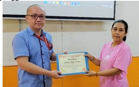
Gambar 9 Penyerahan Sertifikat Kepada Tim Pelaksana PkM

Pengabdian kepada Masyarakat (PkM) ini. Dalam foto tersebut, tampak para peserta, narasumber, dan pendamping berada bersama dalam momen yang menggambarkan kerjasama dan kolaborasi yang terjalin selama kegiatan ini. Momen ini mencerminkan semangat kebersamaan dan tekad untuk mencapai tujuan bersama dalam meningkatkan pemahaman dan keterampilan dalam desain grafis serta penggunaan media sosial.