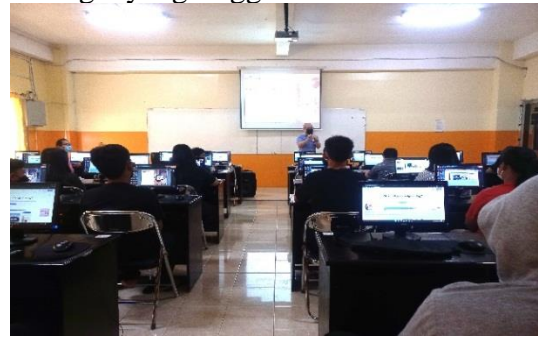
Gambar 2 Pembukaan oleh Perwakilan dari Fakultas Sains dan Teknologi

pengabdian dengan penuh dedikasi dan semangat yang tinggi.