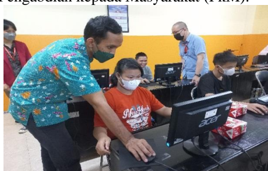
Gambar 5 Praktek Membuat Poster Dengan Canva

Gambar 4 menggambarkan kegiatan praktek yang diadakan selama Program Pengabdian kepada Masyarakat (PkM).