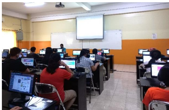
Gambar 4 Penyampaian Praktek Oleh Pemateri

Gambar 4 menggambarkan kegiatan praktek yang diadakan selama Program Pengabdian kepada Masyarakat (PkM).