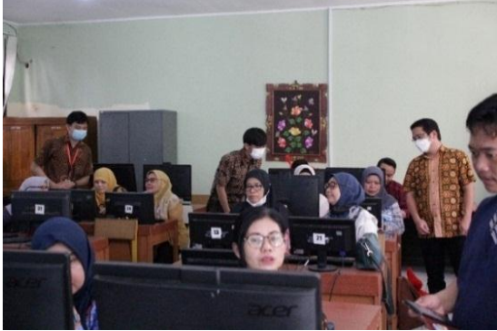
Gambar 5 Praktek membuat slide dengan Canva

tersebut, di mana transfer pengetahuan dan keterampilan sedang berlangsung dengan lancar. Proses pelatihan ini menjadi momen yang berharga di mana peserta memiliki kesempatan untuk meningkatkan kompetensi mereka dan mendapatkan wawasan baru dalam bidang yang relevan.