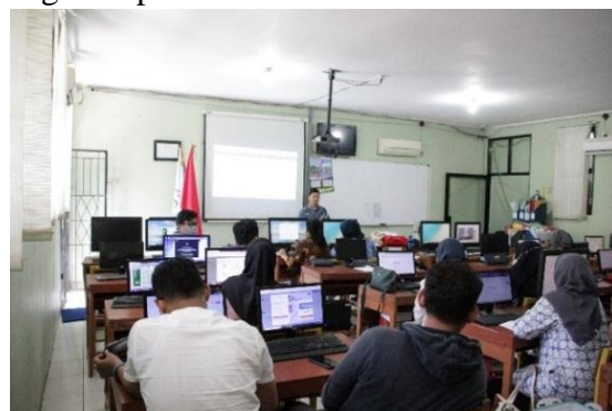
Gambar 4 Narasumber memaparkan materi slide menggunakan Canva

Gambar 3 memvisualisasikan momen penting di mana Universitas Buddhi Dharma (UBD) dan SMAN 3 Tangerang melakukan pemberian pelakat, piagam, dan menandatangani perjanjian kerjasama. Momen ini menandai komitmen kedua belah pihak untuk bekerjasama dalam kegiatan pelatihan ini.