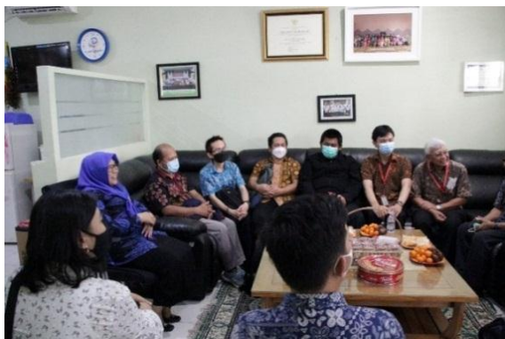
Gambar 2 Perkenalan dengan Kepala Sekolah SMAN 3 Tangerang

keras semua pihak yang terlibat. Ini adalah contoh yang membanggakan tentang bagaimana kolaborasi yang efektif dapat memberikan dampak positif dalam mengatasi masalah dan memberikan manfaat nyata kepada masyarakat. Semoga kolaborasi ini terus berlanjut untuk menginspirasi dan mendorong upaya-upaya pengabdian kepada masyarakat yang lebih luas dan bermanfaat di masa depan. Dalam rangkaian kegiatan PkM yang telah dilaksanakan, kami menjalankan dokumentasi dalam bentuk foto sebagai upaya untuk merekam proses dan hasil dari pengabdian ini. Foto-foto ini tidak hanya menjadi bukti visual tetapi juga mencerminkan beragam kegiatan yang kami lakukan dalam pengabdian kepada masyarakat di SMAN 3 Tangerang. Dengan dokumentasi ini, kami berharap dapat membagikan dan menginspirasi lebih banyak orang tentang pentingnya pengabdian kepada masyarakat dan kolaborasi yang kuat dalam mencapai tujuan bersama. Berikut lampiran dokumentasi: