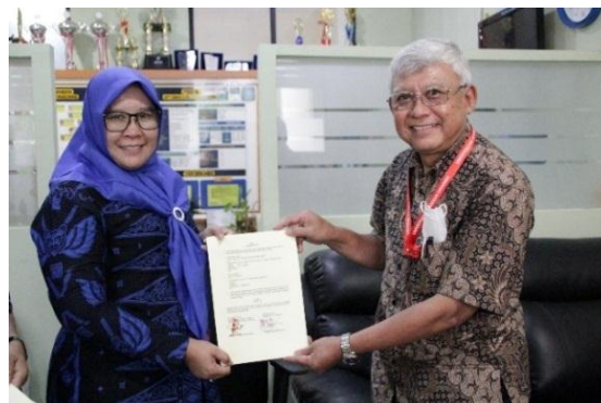
Gambar 3 Penyerahan piagam kegiatan PkM dengan SMAN 3 Tangerang

masyarakat yang akan segera dilaksanakan.