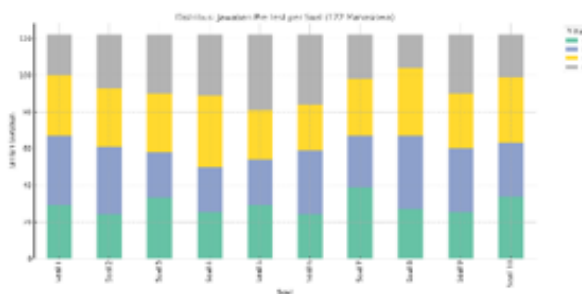
Gambar 2 Jawaban Kuesioner Pre-Test