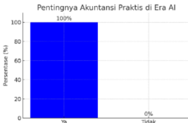
Gambar 7 Kuesioner Evaluasi Akuntansi Praktis 3

Seluruh responden (100%) menjawab "Ya", menunjukkan keyakinan kuat bahwa peran akuntansi praktis tetap relevan dan krusial di tengah kemajuan teknologi.