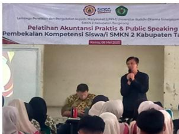
Gambar 1 Kerjasama Dengan Mitra

Gambar tersebut menunjukkan pelaksanaan kegiatan Pelatihan Akuntansi Praktis dan Public Speaking sebagai bagian dari program Pengabdian kepada Masyarakat (PkM) oleh Universitas Buddhi Dharma yang bekerja sama dengan SMKN 2 Kabupaten Tangerang. Pihak SMKN 2 Kabupaten Tangerang menyediakan tempat, peserta, serta dukungan teknis terhadap pelaksanaan kegiatan. Terlihat antusiasme siswa/i yang hadir sebagai