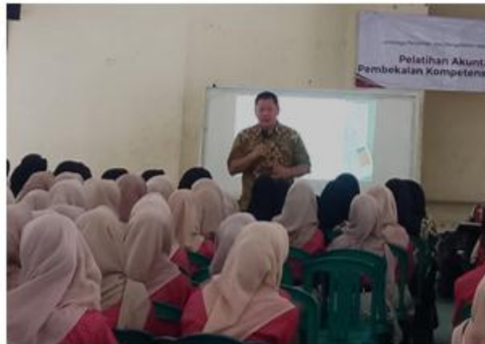
Gambar 3 Penyampaian Materi Akuntansi Praktis Oleh Pemateri

Informasi ini penting untuk mengevaluasi efektivitas pelatihan yang akan diberikan serta membantu penyusunan strategi pembelajaran lanjutan yang lebih tepat sasaran. Berdasarkan hasil analisis awal tersebut, langkah selanjutnya adalah memberikan pendampingan dan pelatihan kepada peserta mitra kerja sama dengan menyampaikan materi dan diskusi untuk memberikan peningkatan pengetahuan, kemampuan dan analisa pada proses pelaksanaan kegiatan berlangsung. Berikut ini proses penyampaian materi dan sesi diskusi untuk pelatihan akuntansi praktis oleh pemateri: