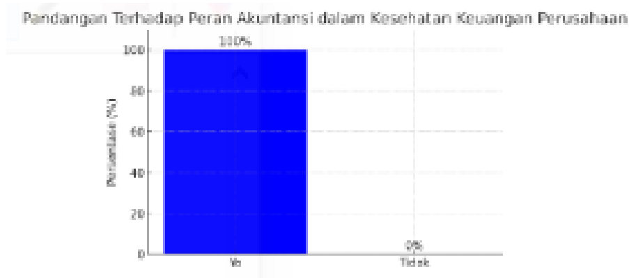
Gambar 6 Kuesioner Evaluasi Akuntansi Praktis 2

menjawab "Tidak", yang mengindikasikan pemahaman dan apresiasi tinggi terhadap fungsi akuntansi dalam dunia bisnis.