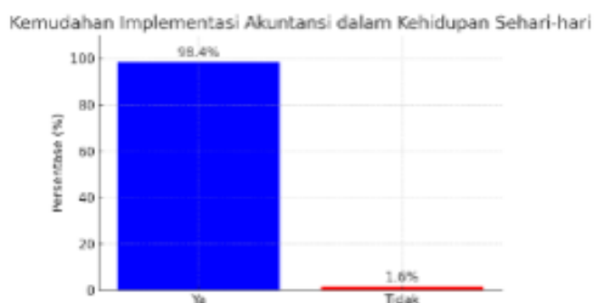
Gambar 8 Kuesioner Evaluasi Akuntansi Praktis 4

bahwa mayoritas merasa akuntansi mudah diterapkan. Hanya 1,6% responden yang menjawab "Tidak", menunjukkan bahwa akuntansi praktis dianggap sangat aplikatif oleh sebagian besar peserta.