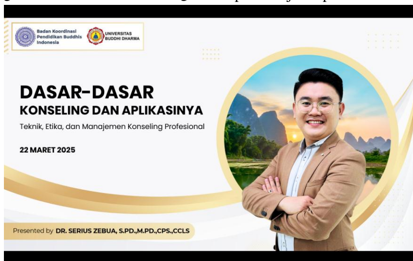
Gambar 1. Flyer Pelaksanaan Kegiatan

Pelaksanaan secara daring tidak mengurangi esensi interaksi akademik dalam pelatihan. Platform digital memungkinkan terjadinya komunikasi dua arah, diskusi partisipatif, serta penyampaian materi secara sistematis. Selain itu, penggunaan media daring mencerminkan adaptasi terhadap perkembangan teknologi dalam praktik pembelajaran profesional.